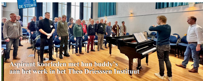
Aspirant koorleden met hun buddy's aan het werk in het Theo Driessen Instituut